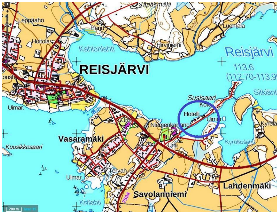
ALUEEN YLEISSIJAINTI. MUUTOSALUE SINISEN YMPYRÄN SISÄLLÄ

Kaavoitustyön tarkoituksena on muuttaa asemakaavaa siten, että alueella toimivan matkailuyrityksen toiminnan ja jatkorakentamisen toteuttaminen on mahdollista ja tarkoituksenmukaista. Alueen yleissijainti ja voimassa oleva kaava ovat oheisilla kartoilla.